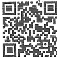
ข้อมูลองค์กรสมาชิก สภาองค์กรของผู้บริโภค