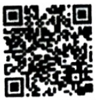
เพลง สดุดีจอมราชา

ทีมที่สมัครคัดเลือกบทเพลงที่ใช้ประกวด 1 บทเพลง ดังนี้