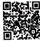
เพลง แสงแห่งรัก