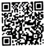
เพลง THE LIGHT OF LOVE